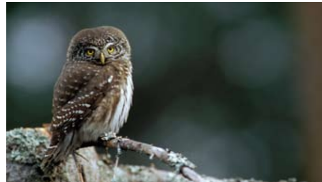
Sparvuggla (Glaucidium passerinum)

Tallen är med sin tjocka bark anpassad till att klara bränder. Idag när stora delar av nationalparken inte brunnit på länge, får tallen allt svårare att hävda sig gentemot granen. Granen förnygrar sig bättre än tallen då träden står tätt och ljuset har svårt att nå marken. På sikt kommer därför andelen gran i skogen att öka på bekostnad av tallen, om inga nya bränder bryter ut.