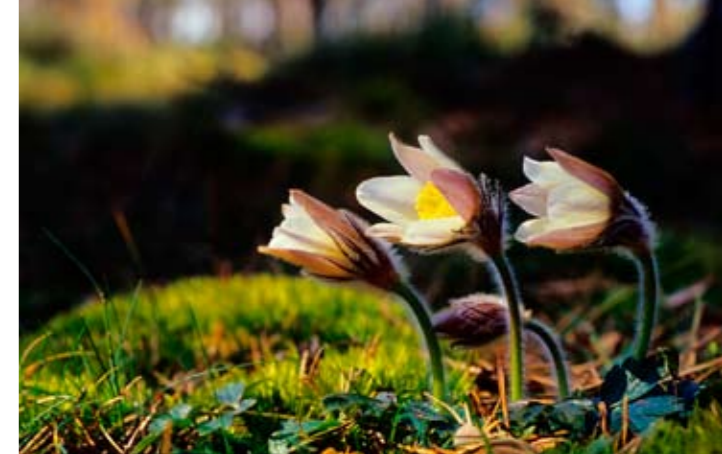
Mosippan (Pulsatilla vernalis) är en art som gynnas av skogsbränder.

För att vara ett barrskogsområde är floran förvånansvärt rik. Drygt 200 mossor, 100 lavar och drygt 200 arter högre växter har påträffats. I granbestånden kan mer krävande örter som vårärt, blåsippan, lundviol och underviol finnas. Karaktärsarter här är björkpyrola och knärot. I sumpskogen nordväst om Stora Idgölen växer bl a missne, topplösa och kärrviol samt nordliga växter som skogsstjärnblomma och repstarr. På vattenytan breder blad av näckrosor och gäddnate ut sig. I bäckravinen växer det sällsynta gräset skogssvingel och dvärghäxört. I den karga tallskogen på höjden växer den ovanliga mosippan. Markvegetationen domineras här annars av ljung och mjölon.