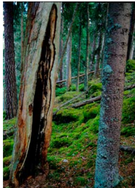
Månghundraårig tall med brandljud efter sammanlagt åtta skogsbränder. Brandljud kallas de sår som uppkommer i barken efter skogsbrand.

Förr var branden skogens normala förnygringsmetod. Skogen i nationalparken har formats av otaliga bränder genom århundradena, både spontant uppkomna och genom mänsklig påverkan. I dag är det över hundra år sedan det senast brann i Norra Kvill. Då eldhärjades ett mindre område i nordväst. Där står det idag självsädd 100-årig tallskog. Ett stort antal tallar i den övriga skogen bär spår av skogsbränder som härjat för länge sedan. Spåren syns ofta nere vid foten av stammen, där barken vallat in brandskadan. Detta kallas för brandljud. I parkens västra del finns tallstubbar som bär spår av upp till sex bränder.