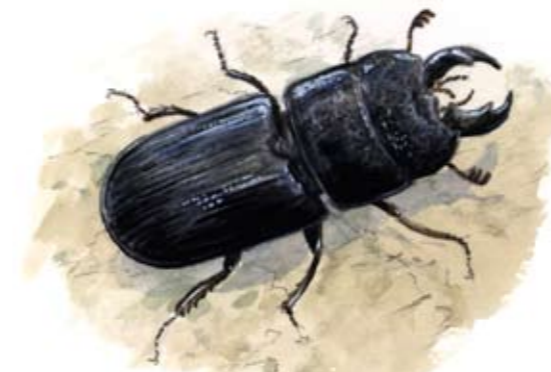
Svartoxe (Ceruchus chrysomelinus)

Djurlivet är typiskt för ett barrskogsområde av detta slag. Älg, rådjur, räv och hare finns i området, även mård har setts. I sjöarna brukar ibland knipa och gräsand förekomma. De vanligaste fåglarna i skogen är bofink, kungsfågel och rödhake. Andra fåglar som förekommer är bland annat sparvuggla, spillkråka och trädkrypare. Insektsfaunan är ovanligt rik och speglar dessutom den gradvisa övergången från eldpåverkad tallskog mot orörd granskog som ständigt pågår i Norra Kvill. Här finns t ex svartoxe som är en skalbagge som trivs i gammal, orörd barrskog och reliktböck som trivs i barken på solbelysta, grova tallar.