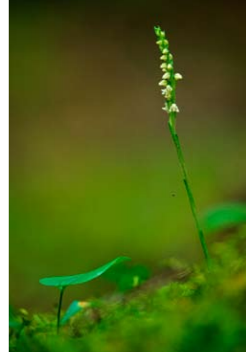
Knärot ( Goodyera repens ) är en karaktärsart i Norra Kvill.

Syftet med Sveriges nationalparker är att bevara större områden i deras naturliga tillstånd för forskning- och friluftssändamål. De skall göras tillgängliga för allmänheten utan att deras ursprungliga karaktär går förlorad.